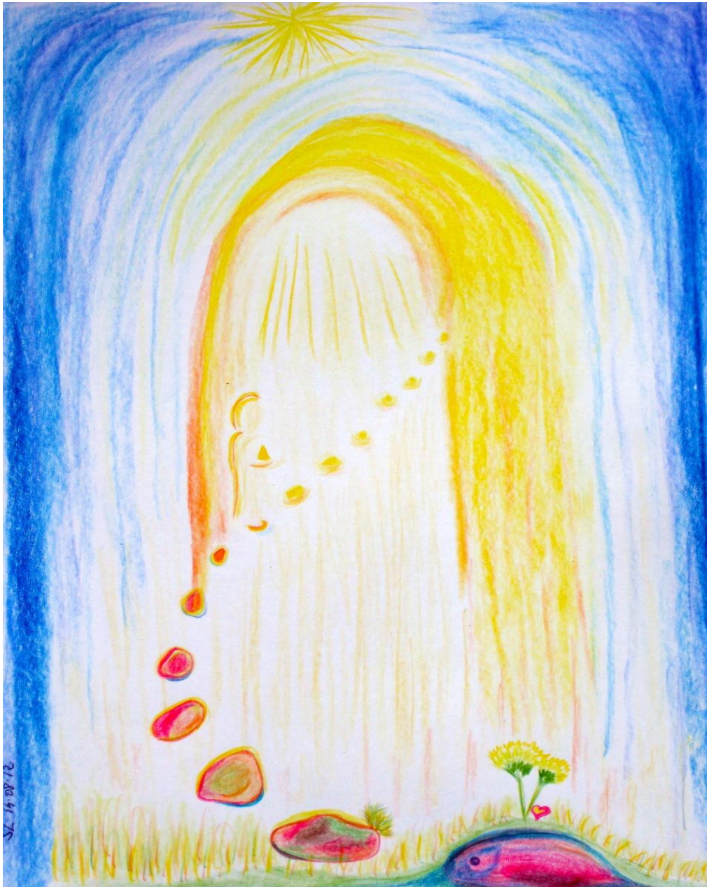
L'Enseignement de Sirius, par SL